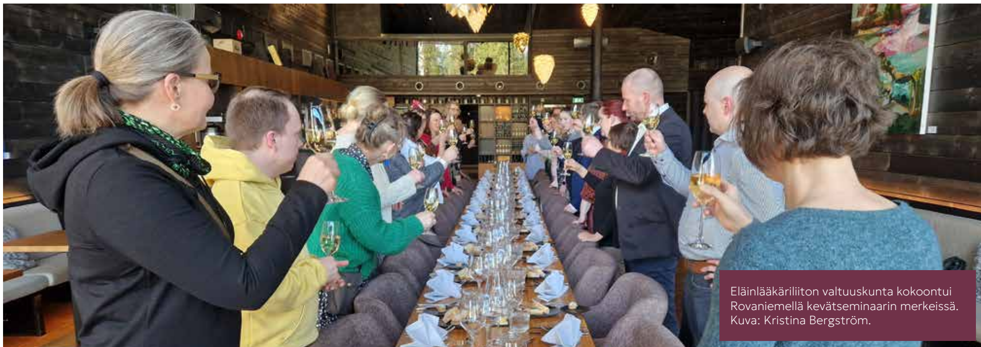
Eläinlääkäriliiton valtuuskunta kokoontui Rovaniemellä kevätseminaarin merkeissä.

Luottamusneuvoston käsittelyyn päätyi yksi asia, jossa kyse oli jäsenen someviestinnästä, joka luottamusneuvoston mukaan oli osin perustunut vajavaisiin tietoihin ja virheellisiin oletuksiin, ja joka oli koettu loukkaavaksi ja harhaanjohtavaksi. Luottamusneuvoston mukaan jäsen oli someviesteissään toiminut liiton tarkoitusperiä ja eläinlääkärikunnan yleisiä kollegiaalisuusperiaatteita vastaan. Neuvosto kehotti hallitusta kiinnittämään jäsenen huomio siihen, että tämä jatkossa paremmin huomioi kollegiaalisuusperiaatteet ja hyvät kirjoitustavat.