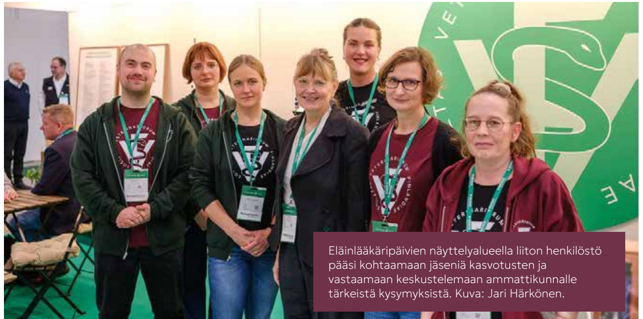
Eläinlääkäripäivien näyttelyalueella liiton henkilöstö pääsi kohtaamaan jäseniä kasvotusten ja vastaamaan keskustelemaan ammattikunnalle tärkeistä kysymyksistä.