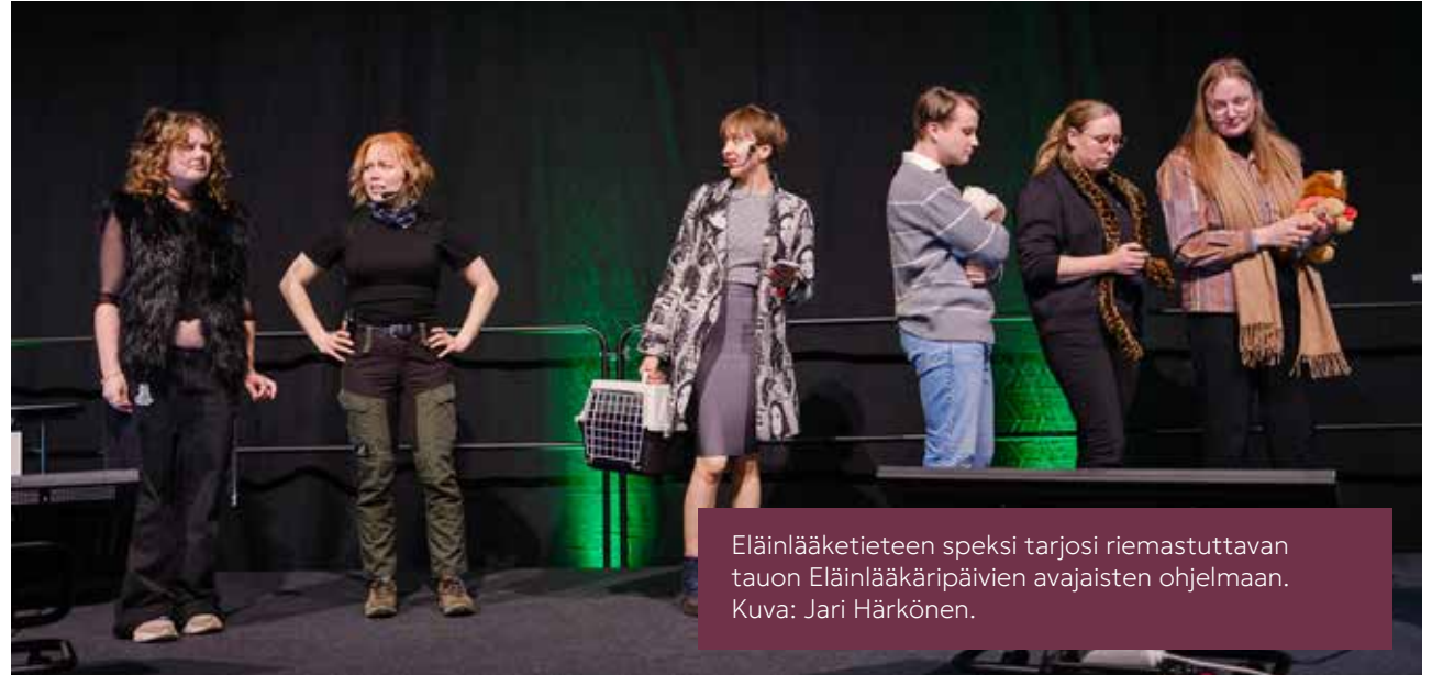
Eläinlääketieteen speksi tarjosi riemastuttavan tauon Eläinlääkäripäivien avajaisten ohjelmaan.

Opiskelijoiden matka-apurahoja jaettiin toimintavuonna 2025 kahdesti. Kevään hakukierrokselle saapui kahdeksan hakemusta ja syksyllä hakemuksia saapui 18 kappaletta 17 eri hakijalta. Eläinlääkäriliiton opiskelijavaliokunnan (OVA) esityksen mukaisesti apurahoja jaettiin keväällä 3 150 euroa ja syksyllä 4 850 euroa.