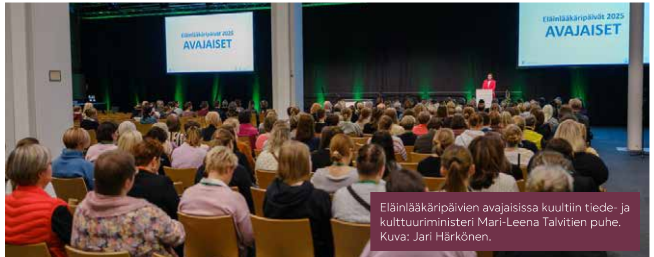
Eläinlääkäripäivien avajaisissa kuultiin tiede- ja kulttuuriministeri Mari-Leena Talvitien puhe.